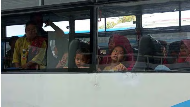
Para warga Air Bangis saat berada dalam bus yang sudah disiapkan untuk membawa mereka pulang ke Pasbar.

wawancara dengan sejumlah warga, mereka menuturkan, pemulangan paksa ini dilakukan dengan cara brutal.