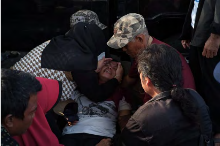
Banyak massa aksi yang pingsan selama aksi damai di depan Kantor Gubernur Sumatera Barat.

Tangis, ratap, amarah, hingga pekik mengandung harap tumpah ruah di Jalan Jenderal Sudirman, Kota Padang.