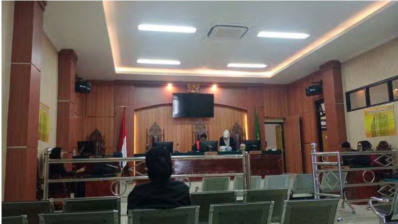
Sidang Praperadilan RK di Pengadilan Negeri Padang Panjang, 27 Maret 2023.

penyidik. Ia optimistis ikhtiar demikian menjadi jalan keadilan bagi RK.