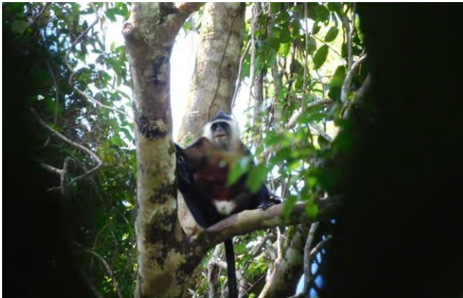
Joja (Presbytis potenziani) primata endemik Mentawai di Hutan Berkat Sipora Utara pada September 2021.

Selama zaman Pleistocene atau Zaman Es, kira-kira satu juta hingga 10 ribu tahun silam, permukaan laut di kawasan Asia Tenggara lebih rendah 200 meter dari sekarang. Hanya Kepulauan Mentawai yang terpisah dari daratan Pulau Sumatera saat pulau lainnya masih menyatu dengan Sumatera.