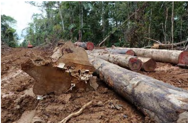
Pohon habitat primata di Hutan Berkat Sipora Utara yang ditebang pada Juni 2022.

Penebangan hutan besar-besaran di Pulau Sipora sejak dua tahun lalu telah menghancurkan habitat penting primata Sipora di Hutan Berkat hingga pantai Puakarayat di Desa Tuapeijat.