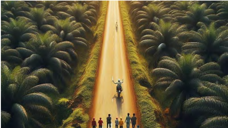
Ilustrasi konflik agraria di perkebunan sawit.