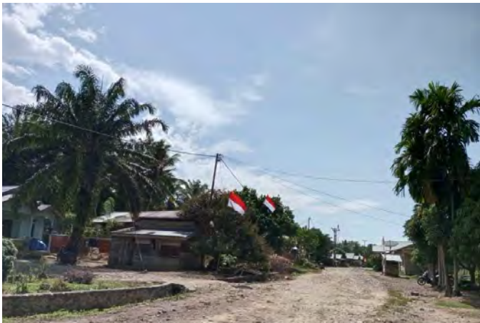
Lanskap Jorong Pigogah Patibubur, Nagari Air Bangis, Kecamatan Sungai Beremas.

Hampir seminggu bertahan di Padang tanpa hasil, warga Air Bangis itu pulang ke kampung hanya meninggalkan bekas luka yang makin menganga. Baik