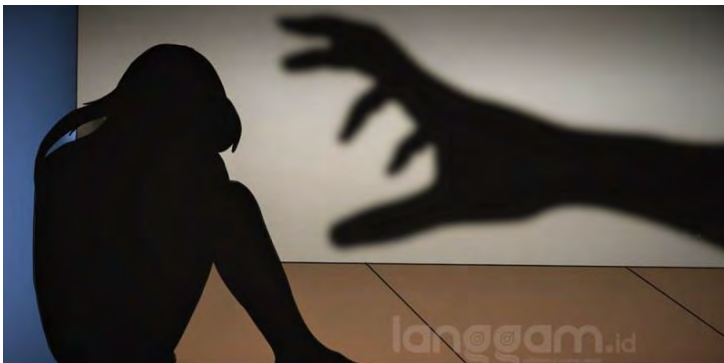
Ilustrasi Pelecehan dan kekerasan seksual