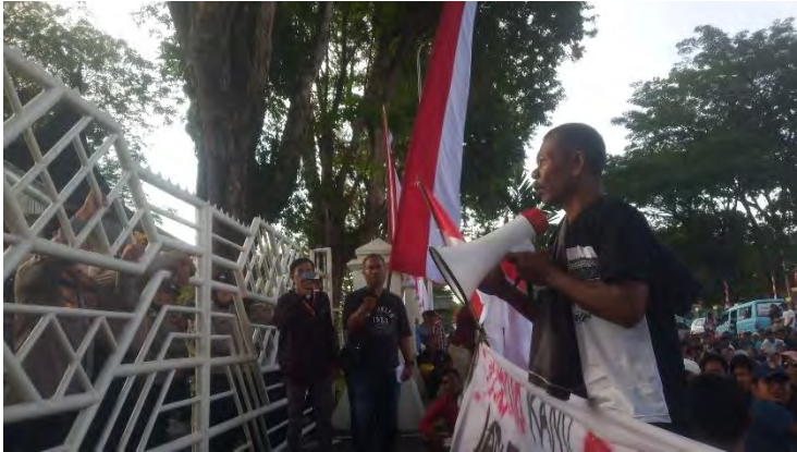
Massa Aksi dari Air Bangis di depan Kantor Gubernur Sumatera Barat.

“Tolong sampaikan pesan kami. Kami adalah bagian dari masyarakat Nagari Aia Bangih. Bukankah Pigogah Patibubur bagian dari negara kita juga? Apakah kami tidak boleh hidup di sana?”