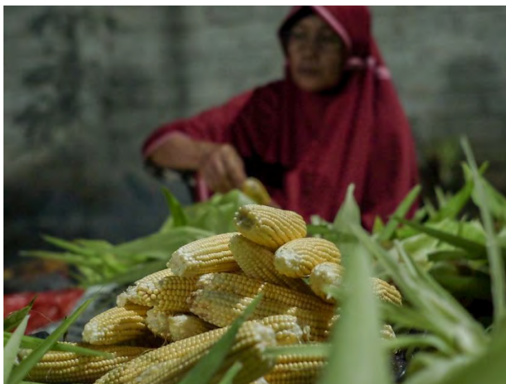
Seorang perempuan membersihkan jagung hasil panen

Kepemilikan tanah ulayat komunal menjadi rentan. Pemerintah Sumatera Barat mencoba membuat regulasinya, bagaimana kelanjutannya?