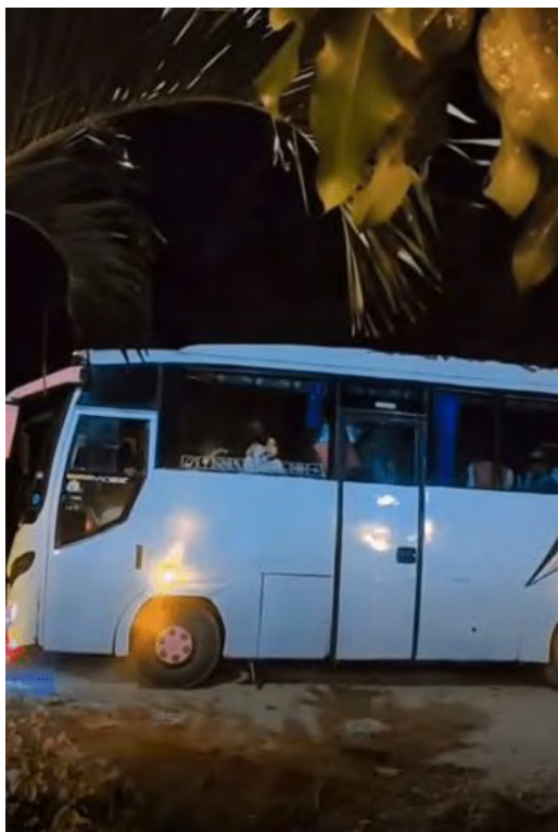
Figure 1Bis yang membawa warga Air Bangis yang berunjuk rasa di Padang selama lebih kurang 6 hari, tiba di Air Bangis, Minggu (6/8/2023).

masyarakat juga dibawa oleh ambulans. Mereka yang tepar terpaksa dilarikan dengan mobil seadanya dari Pigogah ke rumah sakit.