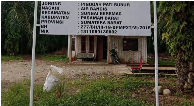
Plang Veron KSU Sekunder HTR.

Penulis: Tim Langgam.id Editor: Yose Hendra