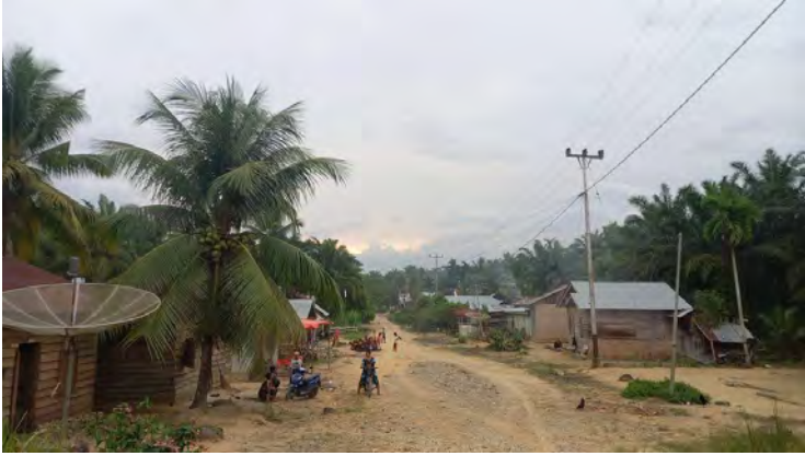
Suasana Jorong Pigogah Patiburur Nagari Air Bangis, Provinsi Sumatera Barat.

“Saya sangat sedih melihat tanah-tanah ulayat yang di Pigogah itu dikuasai oleh para tuan tanah. Banyak dari mereka yang menguasai banyak lahan, padahal itu tanah nagari tapi anak-anak kami hanya menjadi nelayan,” ujarnya.