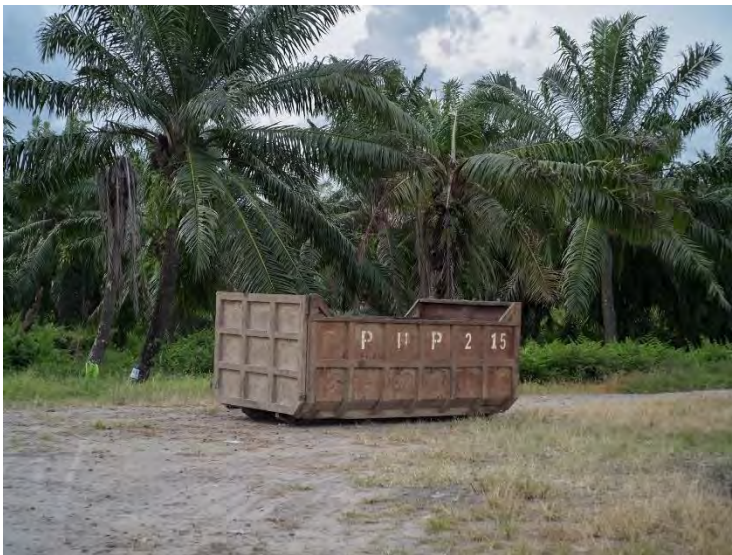
Bekas bak truk sawit PT PHP ditinggalkan di Kapa