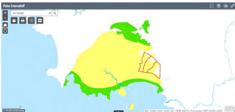
Peta Izin HTR Koperasi di Air Bangis, terletak di atas hutan produksi dan pemukiman warga, serta beberapa Areal Penggunaan Lain.

Semua itu tertuang dalam Keputusan Bupati Pasaman Barat Nomor: 188.45/548-550/BUP-PASBAR/2014. Semuanya ditandatangani dalam waktu yang sama, 20 Juni 2014. Dengan jangka waktu berlaku selama 60 tahun.