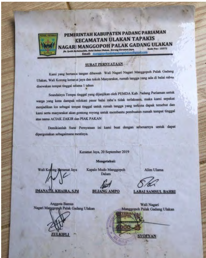
Figure 3 Surat Perjanjian yang didapat Kartini/roehanaproject/M Afdal Afrianto