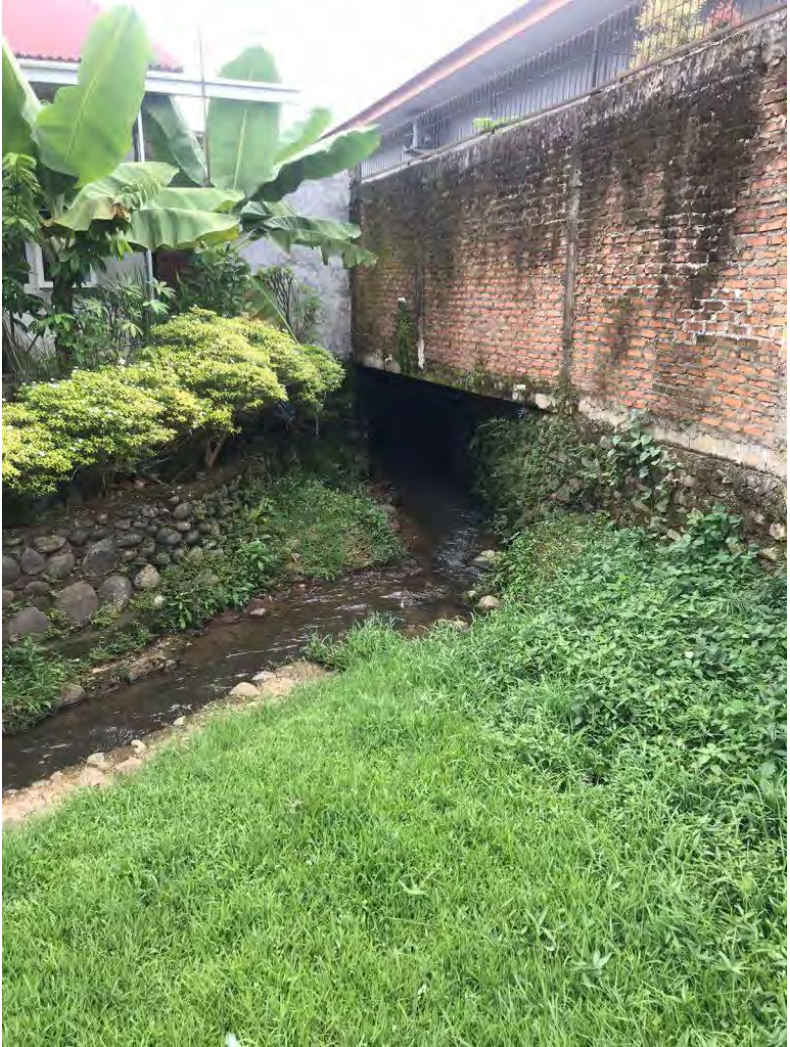
Salah satu sungai alam di Kota Padang yang menyempit karena pembangunan.