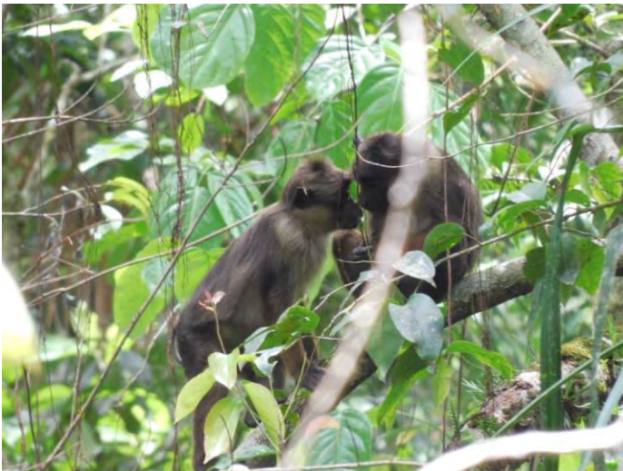
Dua ekor Bokoi ( Macaca pagensis ) di hutan Berkat pada September 2021.

“Yang paling kita khawatirkan primata akan kehilangan habitat, degradasi hutan atau gangguan terhadap habitatnya saja sudah bisa menurunkan jumlah populasi primata, apalagi kalau hutannya di- clearing , itu akibatnya akan sangat parah,” ujarnya.