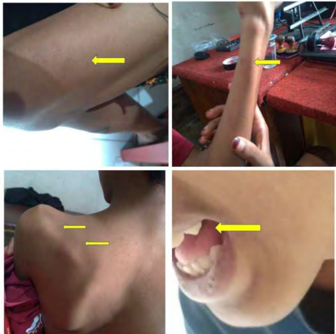
Jejak dugaan penyiksaan yang dialami oleh RK dalam proses penyidikan kasus dugaan pencurian kendaraan bermotor di Mapolres Padang Panjang.

Dalam surat tersebut Fadhilah menyampaikan, trauma yang dialami RK belum hilang sampai saat ini. "Klien kami dan juga keluarga besarnya telah mengalami hal yang kembali menakutkan yaitu beberapa kali didatangi oleh orang yang