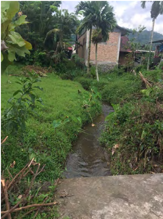
Salah satu sungai alam yang menyempit karena pembangunan. (Foto oleh: Je Wanggay).

Saya berkunjung ke rumahnya keesokan harinya. Tepat di samping rumah Yuda terdapat sungai kecil yang dulunya mengalirkan air ke sawah-sawah terdekat. Hanya saja sekarang sungai itu sudah tertutupi 2 rumah. Ya, dua rumah tersebut dibangun tepat di atas sungai yang berfungsi sebagai drainase alam.